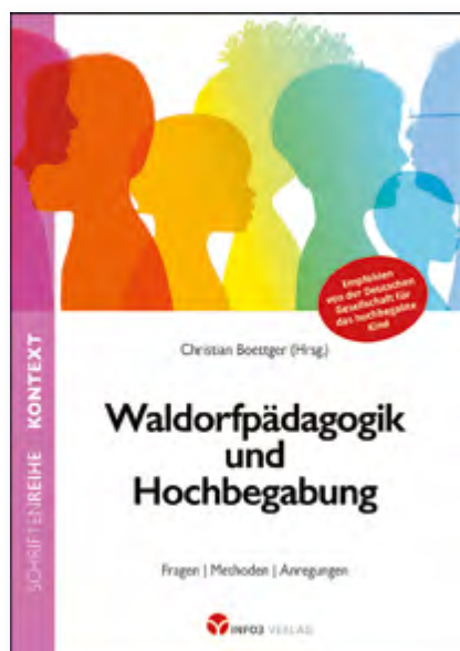
Christian Boettger (Hrsg.) Waldorfpädagogik und Hochbegabung Fragen | Methoden | Anregungen, Paperback, 328 Seiten € 9,90 (statt € 22,00) Art.Nr. 7173

Dieses Buch beschreibt die Möglichkeiten der Waldorfpädagogik, hochbegabte Schüler:innen in ihrer Vielzahl von Veranlagungen und Fähigkeiten wahrzunehmen und zu fördern.