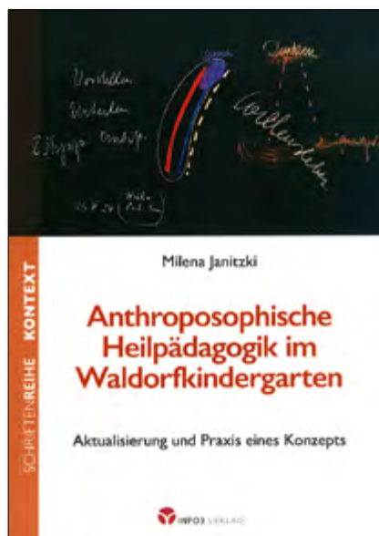
Milena Janitzki, Anthroposophische Heilpädagogik im Waldorfkindergarten Aktualisierung und Praxis eines Konzepts Paperback, 124 Seiten, Format 14,8 x 21 cm € 18,00 Art.Nr. 7245

Die vorliegende Schrift beschäftigt sich mit der anthroposophischen Heilpädagogik mit Blick auf den Waldorfkindergarten. Ein wichtiger, engagierter Beitrag zur Fortentwicklung von Waldorfpädagogik.