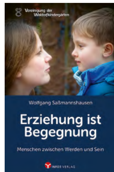
Wolfgang Saßmannshausen, Erziehung ist Begegnung , Menschen zwischen Werden und Sein, Herausgegeben von der Vereinigung der Waldorfkindergärten, Klappenbroschur 96 Seiten, € 7,95 (statt € 12,00) Art.Nr. 7099

Damit Erziehung und Bildung Gegenwartserfüllung werden, braucht es die Bereitschaft, dem Strom der Zeit zu lauschen und mit Kopf, Herz und Verstand das Tor für die Zukunft zu suchen und zu öffnen.