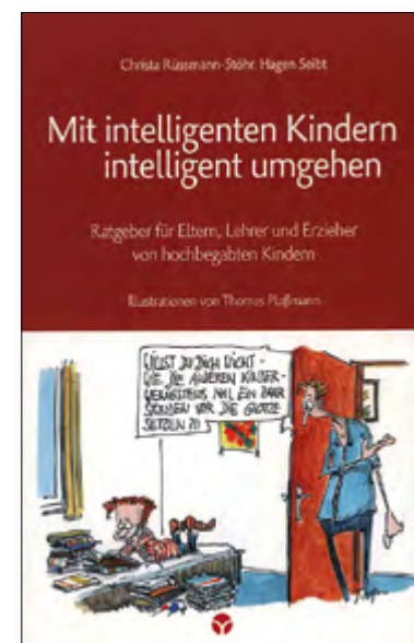
Christa Rüssmann-Stöhr, Hagen Seibt, Mit intelligenten Kindern intelligent umgehen Ratgeber für Eltern, Lehrer und Erzieher von hochbegabten Kindern Illustrationen von Thomas Plaßmann Broschur, 266 Seiten, Illustrationen von Thomas Plaßmann, € 22,00 Art.Nr. 7022

Hochbegabte Kinder sind oft alles andere als glückliche Kinder. Das muss nicht sein. Die Autoren, beide Diplom-Psychologen, geben in unzähligen Fällen praktische Hilfestellungen für den Erziehungsalltag.