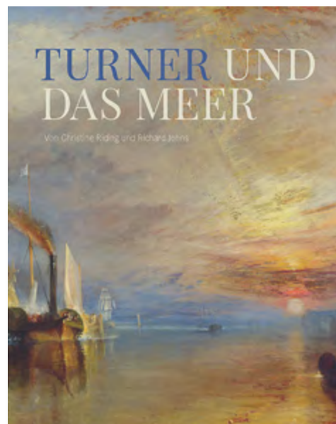
Christine Riding, Richard Johns, Turner und das Meer Klappenbroschur, 288 Seiten, Format 30 x 23,5 cm 225 farbige Abbildungen € 25,00 (statt € 48,00) Art.Nr. 5548

Das Buch zeigt die ganze Bandbreite von Turners Auseinandersetzung mit der maritimen Malerei und wirft ein neues Licht auf seine berühmtesten Bilder.