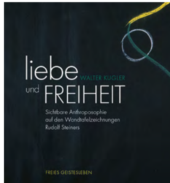
Walter Kugler, Liebe und Freiheit , Sichtbare Anthroposophie auf den Wandtafelzeichnungen Rudolf Steiners, Hardcover mit Schutzumschlag, 264 Seiten, Format: 22 x 23,5 cm mit zahlreichen ganzseitigen farbigen Abbildungen € 49,00 Art.Nr. 5556

Jedes Erscheinen in der sinnlichen Welt, jede Materialisierung und Verleiblichung geschieht, laut Steiner, aus der Kraft der Liebe. In Hunderten von Wandtafelzeichnungen zu seinen Vorträgen hat Rudolf Steiner den Weg des Menschen und der modernen Kunst vorgezeichnet.