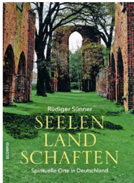
Rüdiger Sünner, Seelenlandschaften – Spirituelle Orte in Deutschland Klappenbroschur, 240 Seiten, Format 17,5 x 24 cm zahlreiche farbige Fotos € 29,00 Art.Nr. 5557

Das Buch zum Film ist ein spiritueller Führer zu mythischen Orten in einer immer seelenloseren Zeit und gleichzeitig ein Plädoyer für Entschleunigung und Achtsamkeit in einer reizüberfluteten Gesellschaft.