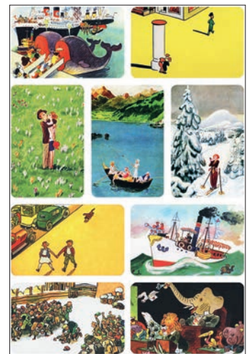
Memospiel „Walter Trier“ , 25 Bildpaare mit Illustrationen aus Kästners Kinderbüchern, Format 10 x 13 x 4 cm (Box) 16 Seiten Booklet, € 16,00 Art.Nr. 5494

Dieses Memo-Spiel mit 25 Illustrationen entführt in die Welt von Kästners Kinderbüchern. Ein großer Spaß für die ganze Familie.