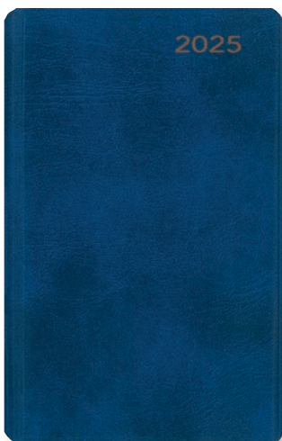
Urachhaus-Taschenkalender 2025 160 Seiten, eingebunden in Cabra-Lederfaserstoff, Format: 9,7 x 15,8 cm € 22,00 Art.Nr. 5486

Der Urachhaus Taschenkalender erfreut sich seit vielen Jahrzehnten großer Beliebtheit. Zum 100-jährigen Bestehen des Verlags erscheint er in einer gediegenen Ausstattung.