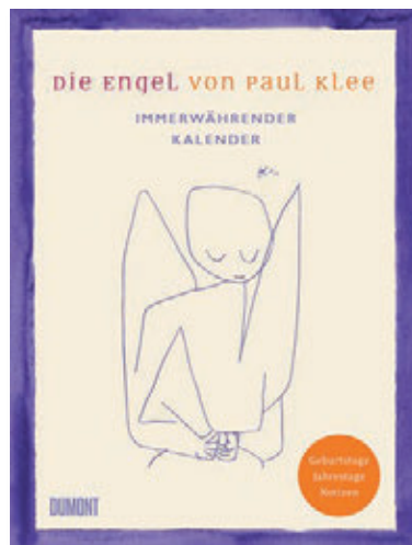
Die Engel von Paul Klee - Immerwährender Kalender , 176 Seiten, Hardcover, viele farbige und s/w-Abb., Format 14 x 18,5 cm € 20,00 Art.Nr. 5489

Ein Begleiter, den man immer wieder gerne in die Hand nimmt und der mit seiner schönen Gestaltung einen festen Platz auf dem Schreibtisch oder neben dem Bett einnehmen kann.