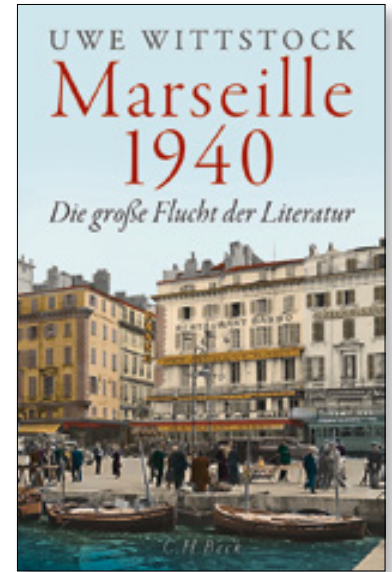
Uwe Wittstock, Marseille 1940 Die große Flucht der Literatur 352 Seiten, gebunden mit Schutzumschlag mit 28 Abbildungen und 2 Karten € 26,00 Art.Nr. 5440

Die aufwühlende Geschichte der Flucht von Schriftstellern und Künstlerinnen vor den Nazis