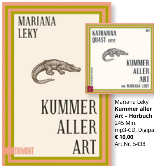
Mariana Leky Kummer aller Art - Hörbuch 245 Min. mp3-CD, Digipack € 10,00 Art.Nr. 5438

Klug, humorvoll und mit großem Sinn für Feinheiten und Absurditäten porträtiert Mariana Leky menschliche Lebenslagen.