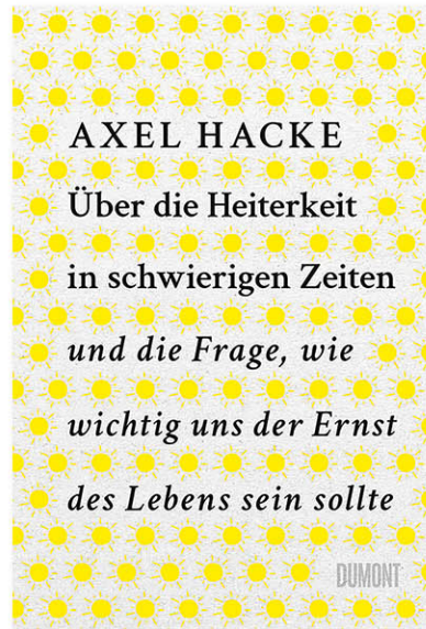
Axel Hacke Über die Heiterkeit in schwierigen Zeiten und die Frage, wie wichtig uns der Ernst des Lebens sein sollte, 200 Seiten, gebunden mit Schutzumschlag mit Lesebändchen € 20,00 Art.Nr. 5342

Unterhaltsam, klug und persönlich erklärt Axel Hacke, warum Heiterkeit eine Lebensphilosophie ist