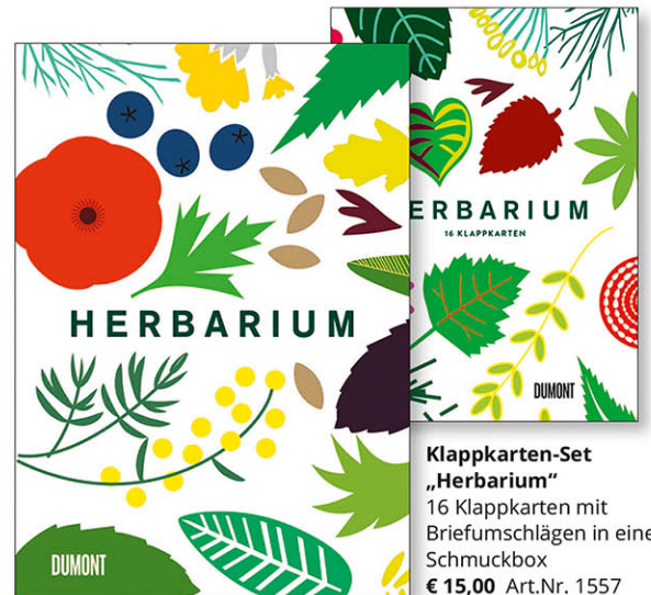
Caz Hildebrand, Herbarium 224 Seiten, gebunden, Fadenheftung 100 farbige Abbildungen, bedruckter und geprägter Einband mit Rundum-Farbschnitt, passendem farbigem Vorsatz und Lesebändchen, Format 25 x 18 cm € 30,00 Art.Nr. 5348

„Von diesem Buch brauche ich drei Exemplare: eines für die Küche, eines, um es im Bett zu lesen, und ein weiteres, um es zu zerschneiden und meine Wände damit zu dekorieren.“ Yotam Ottolenghi