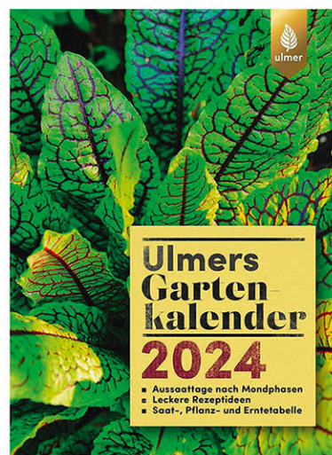
Ulmer's Gartenkalender 2024 Aussaatage nach Mondphasen. Leckere Rezeptideen. Saat-, Pflanz- und Erntetabelle 208 Seiten, 130 Farbfotos, Spiralbindung, Format 21 x 16 cm € 12,00 Art.Nr. 5339

In Ulmers Gartenkalender 2024 entdecken Sie Monat für Monat die besten Tipps für eine leckere und gesunde Obst- und Gemüseernte im Garten.